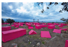
graft_ridecos1.jpg GRAFT, „Pink Project“, New Orleans 2007