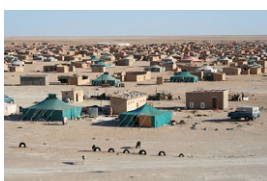
herz.jpg Flüchtlingslager, Western Sahara