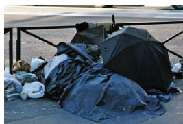
mlecko.jpg Martin Mlecko, aus der Serie „BEAUTIES & beasts“, 2007