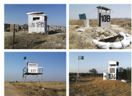
linke.jpg Armin Linke, Auswahl von Fotos aus dem Archiv des UNFICYP. Dank an Jozef Kocka und Brian Kelly, 2007