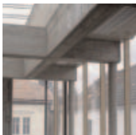
Dialektinstitut.jpg Dialektinstitut Oberschützen(Bgl.) Architektur Hans Gangoly, 2002–04