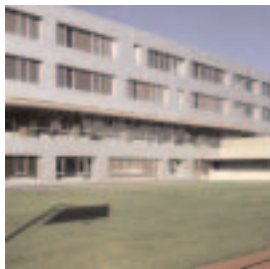
Borg1.jpg BORG Dreierschützengasse, Graz Architektur Hans Gangoly, 2001–02