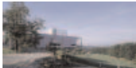
Schmuck1.jpg Haus Schmuck, Graz Architektur Hans Gangoly, 2004–05 Bildnachweis: © Paul Ott

Die Bilder können Sie in einer Auflösung von 72 dpi bzw. 300 dpi (Bildbreite zwischen 6 und 15 cm) von unserer Web-Site „www.aut.cc“ im Pressebereich downloaden und nur im Rahmen der Berichterstattung über die Ausstellung und unter Anführung des Bildnachweises „Foto © Paul Ott“ verwenden.