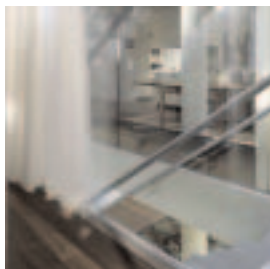
Schmuck2.jpg Haus Schmuck, Graz Architektur Hans Gangoly, 2004–05