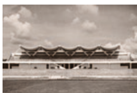
KatstallerSchott_StadionSantaAna_KS.jpg Sportstadion Óscar Quiteño, Santa Ana, 1963