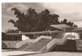
KatstallerSchott_Museum_KS.jpg Staatliches Museum für Anthropologie, San Salvador, 1962