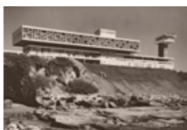
KatstallerSchott_Cepa_KS.jpg Hafenverwaltung CEPA, Acajutla, 1958

Weiteres frei verwendbares Bildmaterial steht Ihnen nach Aufbau der Ausstellung im Juli 2024 auf unserer Web-Site zur Verfügung.