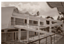
KatstallerSchott_SanVicente_KS.jpg Primarschule, San Vicente, um 1954