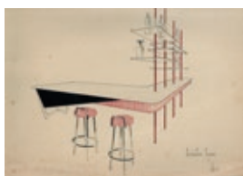
KatstallerSchott_Interieur_KS.jpg Skizze für Innenausstattung Residencia Paloma, Ehrentraut Schott, 1956 Bildnachweis: © Archiv Ehrentraut Katstaller-Schott, Karl Katstaller