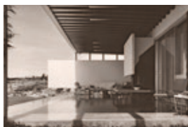
KatstallerSchott_FunesHartmann_KS.jpg Haus Funes Hartmann, San Salvador, um 1960