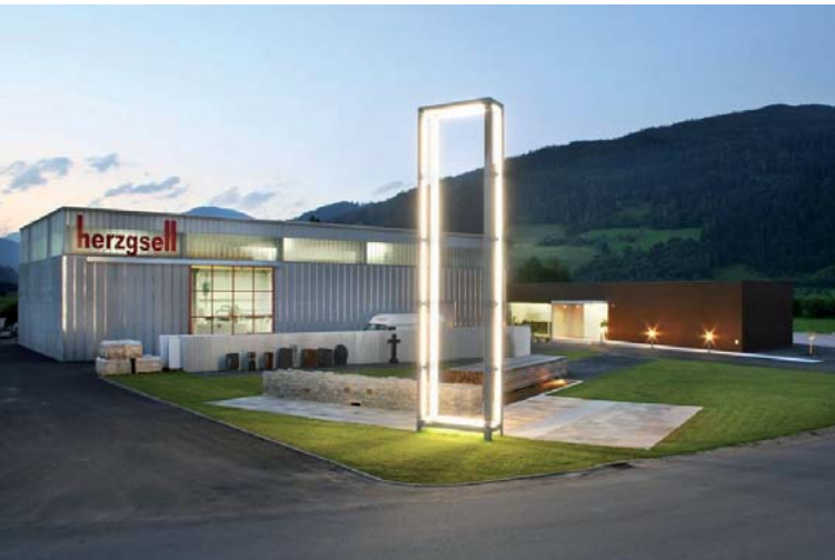
Steinmetzbetrieb Herzgsell; Architektur: LP architektur