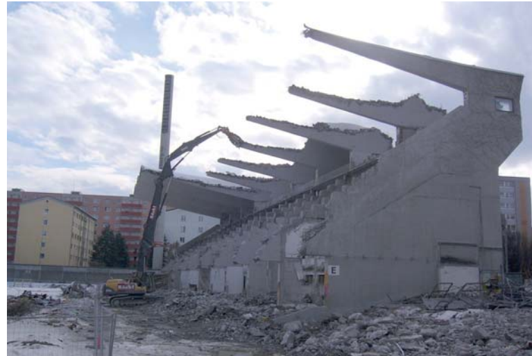
Altes Stadion Lehen