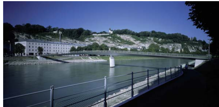
Makartsteg; Architektur: HALLE 1