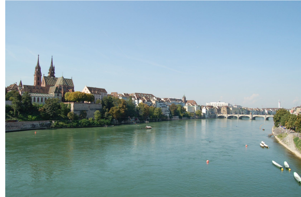
Basel mit Rhein

Donnerstag, 08. Juni – Sonntag, 11. Juni 2023