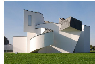
Vitra Design Museum, Architekt: Frank Gehry