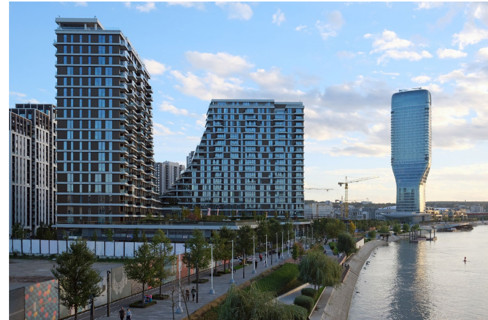
Belgrade Waterfront

Donnerstag, 09. Mai – Sonntag, 12. Mai 2024